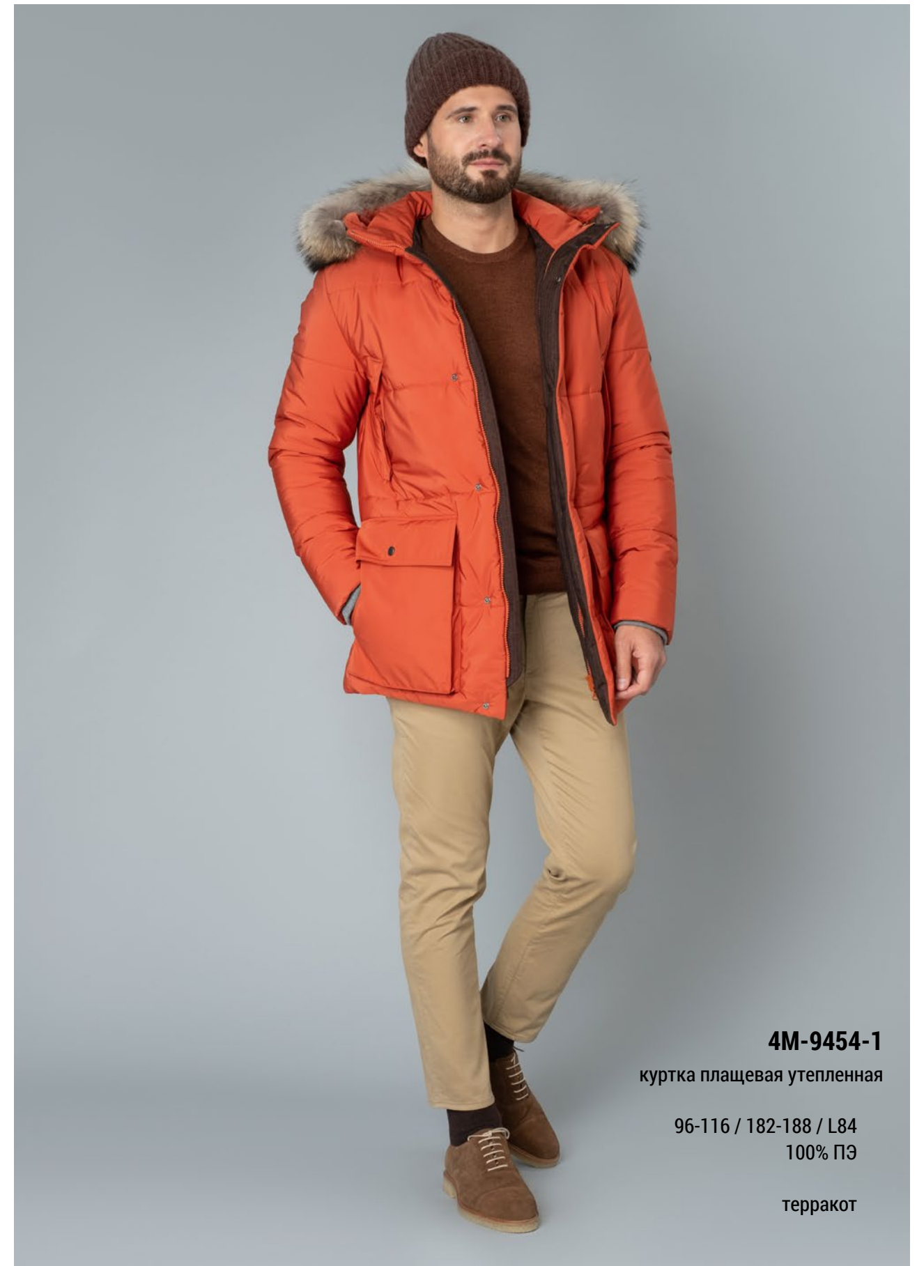
4M-9454-1 куртка плащевая утепленная 96-116 / 182-188 / L84 100% ПЭ терракот